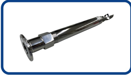
ヘルールねじソケット