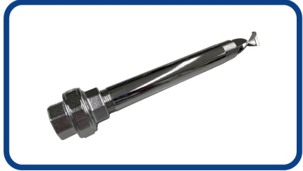
ねじ込みユニオン

食品・飲料業界、医薬品、半導体業界では、CIP（Clean In Place）定置洗浄が求められており、電解研磨されたSUS316L製スタティックミキサーがおすすめで、 簡単に洗浄できるようエレメントも取り外し可能です。