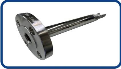
JIS 10K RF ねじフランジ

テフロンモデルは、全ての部材がPTFE製で、クリーン且つ耐食性・耐薬品性が求められる用途で使用できます。サニタリー仕様への追加バフ研磨へも対応！ ■バフ研磨+電解研磨標準仕様■